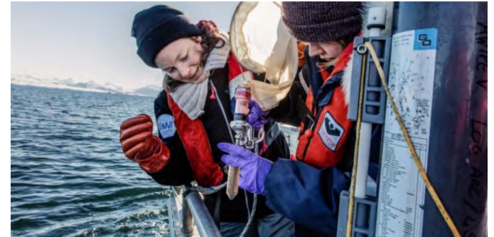
ELBE, HZDR // AWI