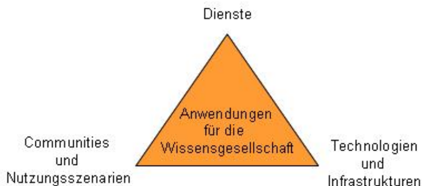
Abb. 2: Anwendungen für die Wissensgesellschaft

Mit einer Initiative zur Stimulierung von Web 2.0-Anwendungen lassen sich Innovationen auf vier Ebenen realisieren (vgl. Abb. 2): Produktinnovationen durch die Anwendungen selbst; soziale Innovationen innerhalb bereits existierender oder neuer Communities, die beispielhaft in alle gesellschaftlichen Bereiche auszustrahlen vermögen, technologische Innovationen sowie Innovationen bei Wissenserwerbs- und Bildungsprozessen und den Organisationen, die diese Prozesse tragen.