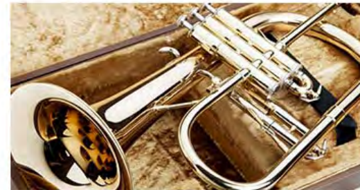
Kurs 1 André Stärk