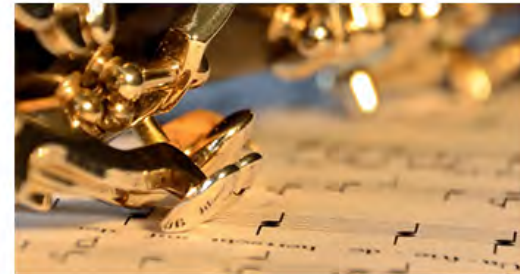
Kurs 4 André Stärk