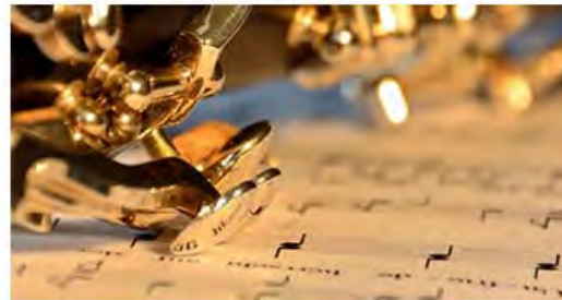
Kurs 4 André Stärk