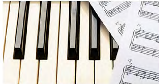
Das Klavier - eine Einführung Markus Klug